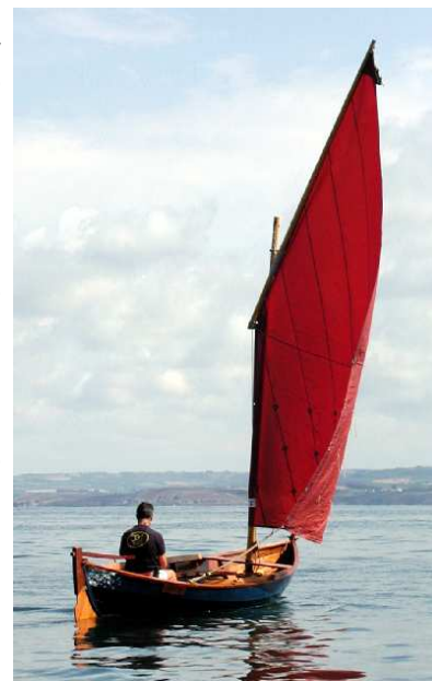
Voile au tiers simple